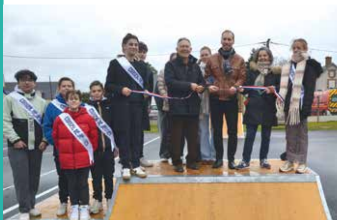
Inauguration du skate park et terrain de basket du dimanche 08 décembre

Merci à l'ensemble des personnes nous ayant aidé à mettre en place ce projet.